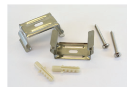
Eléments de fixation

Les normes internationales fixent la tolérance du flux lumineux et de la charge associée à ± 10 %. La température des couleurs est soumise à une tolérance pouvant aller jusqu'à +/-150° Kelvin par rapport à la valeur nominale