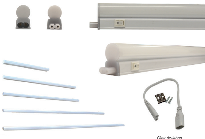
Câble de liaison