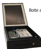
Boite alimentation et contrôleur DMX (Ref : 80290)